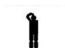
Figura 2 Non richiedo assistenza, sono ok

Agitare il braccio con mano aperta sopra la testa.